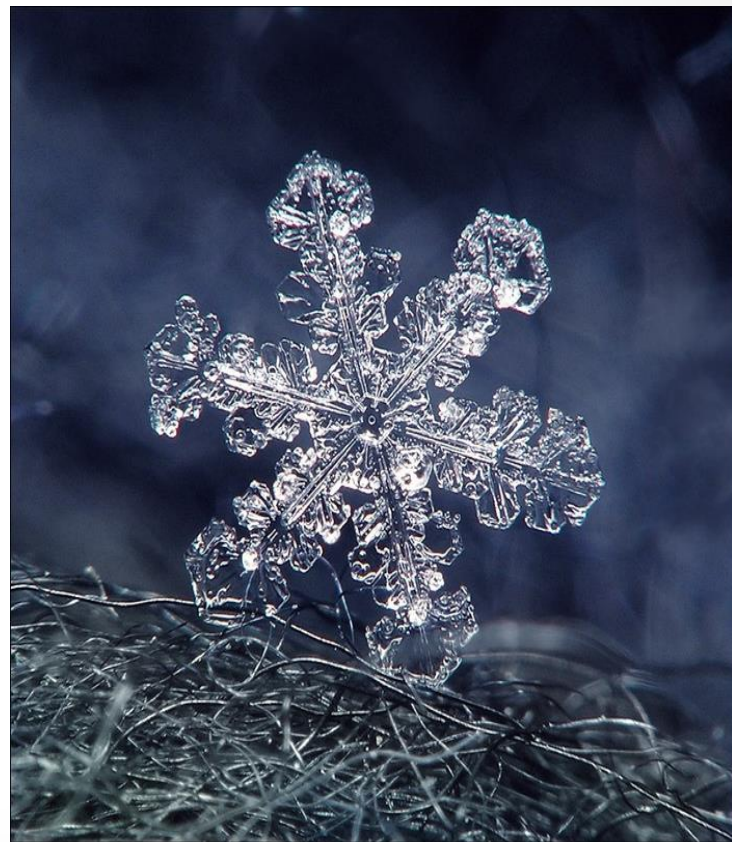
Фото снежинки ПОД МИКРОСКОПОМ

❖ Зимушка-зима... Приходят морозы. Холодный воздух приносит тучи, в которых капельки дождя превращаются в ледяные кристаллы - снежинки.